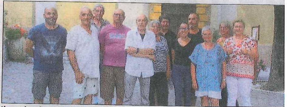
L'une des demandes portées par le conseil municipal: la réalisation d'un parking, au-dessus de l'allée du Champon.

L es élus communaux ne chôment pas et l'élaboration des dossiers de subventions va bon train pour améliorer le cadre de vie du village. La restauration du sas de l'église Saint-Arige est en cours de finition grâce à des subventions de la Région, du Département et de la Direction régionale des affaires culturelles. Les élus déposeront un dossier en vue de réaliser un parking de dix places au-dessus de l'allée du Champon. Une subvention complémentaire sera demandée dans le cadre de la dota-