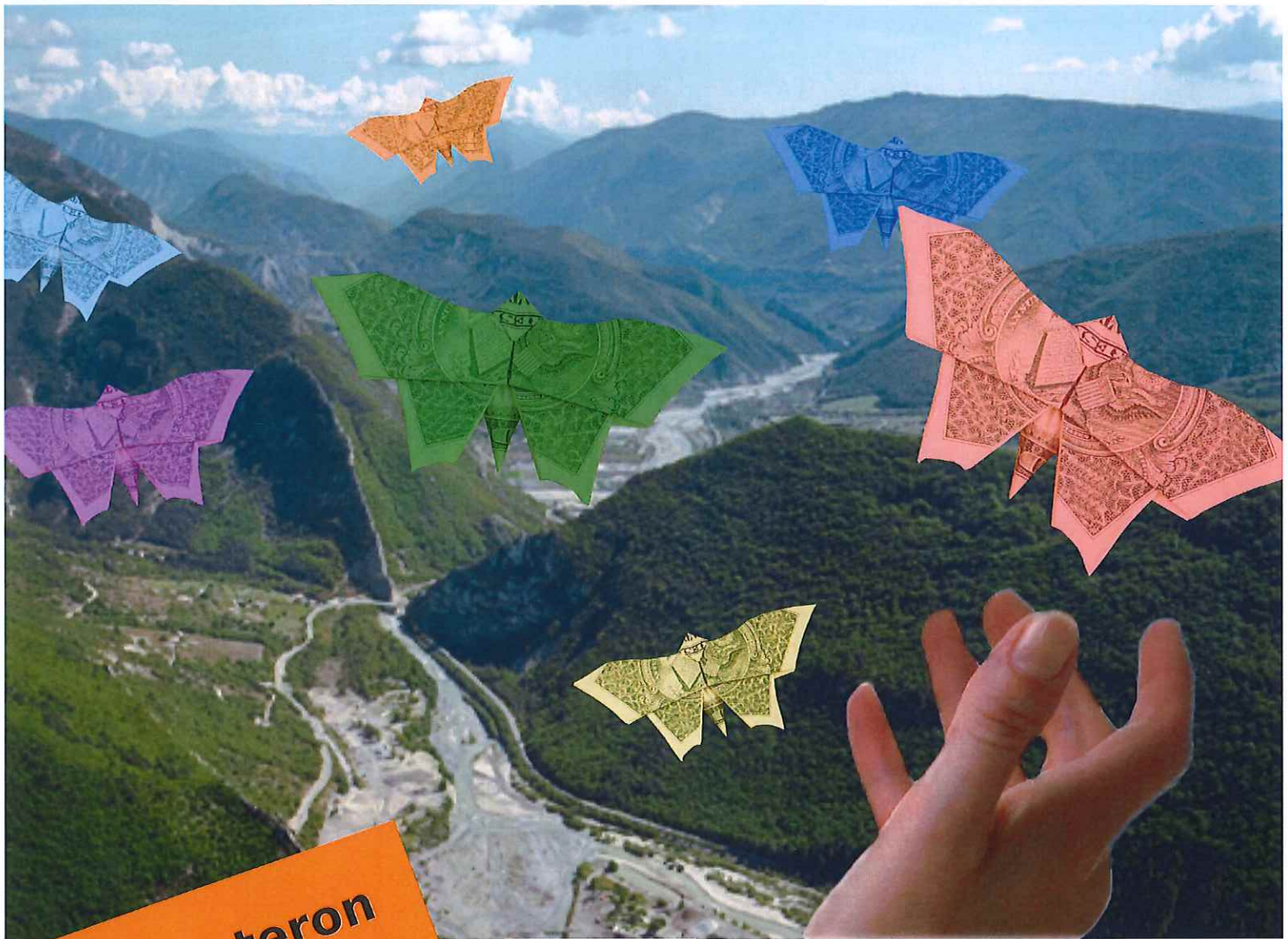
Table ronde avec vous , futurs partenaires et utilisateurs, acteurs d'une relocalisation de notre économie